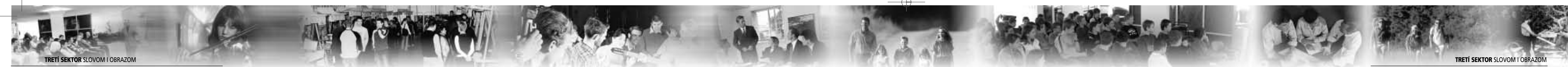
TRETÍ SEKTOR SLOVOM I OBRAZOM