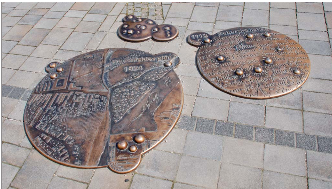
▲ Pamätná tabuľa umiestnená na pešej zóne v Piešťanoch, znázorňujúca Frauenfeldov plán (1824) a Zoborskú listinu (1113). Memorial plaque located in the pedestrian zone in Piešťany depicting the Frauenfeld Plan (1824) and the Zobor Scroll (1113). Gedenktafel mit Darstellungen des Frauenfeld-Plans (1824) und der Zobor-Urkunde (1113) in der Fußgängerzone von Piešťany