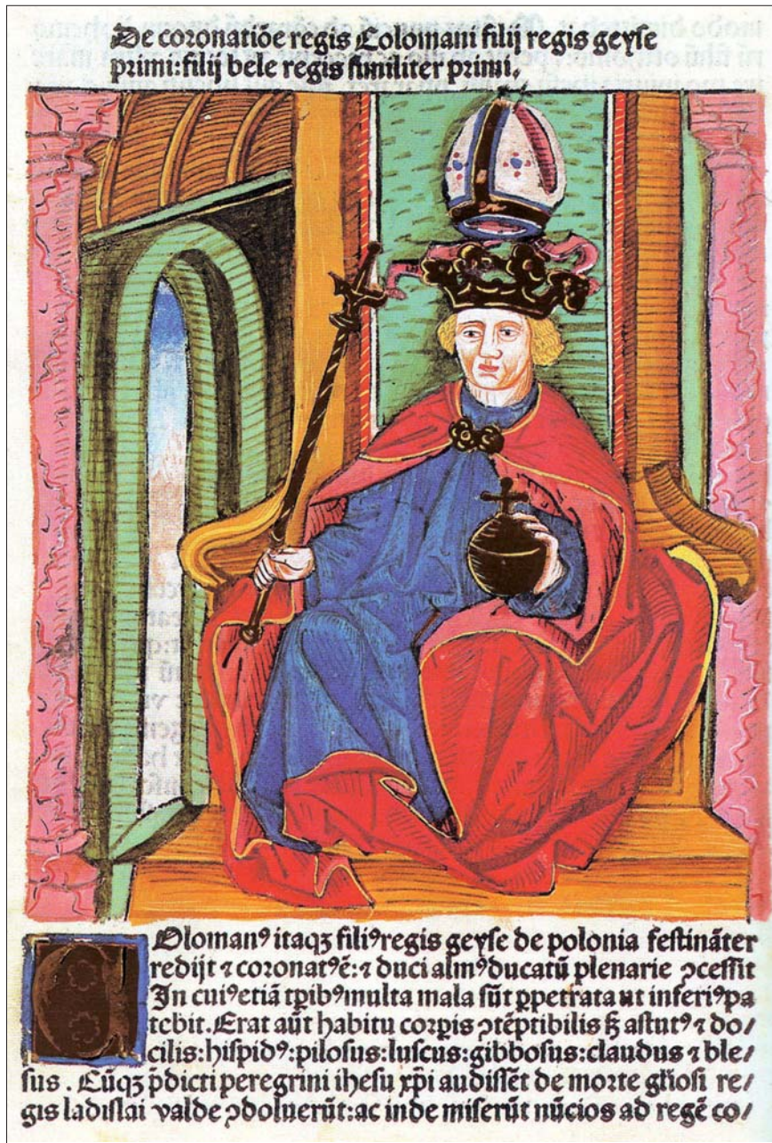
▲ Koloman I., nazývaný Učený, v kronike J. Thurčczyho (1488). Koloman I., referred to as Učený, in the chronicle of J. Thurčzy (1488). Koloman I., genannt der Buchkundige, in der Chronik von J. Thurčzy (1488)

And so, this year, Piešťany will observe the 900th anniversary of the date it stepped from anonymity and the inconsistency of oral lore into the light of the world in written form. A scribe's hand recorded it on parchment, which despite many centuries, has been preserved to this day. ■