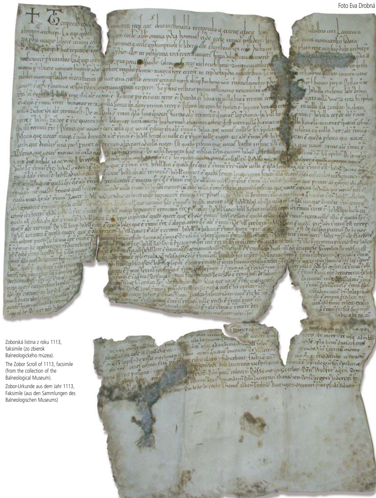
Zoborská listina z roku 1113, faksimile (zo zbierok Balneologického múzea). The Zobor Scroll of 1113, facsimile (from the collection of the Balneological Museum). Zobor-Urkunde aus dem Jahr 1113, Faksimile (aus den Sammlungen des Balneologischen Museums)