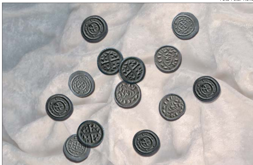
Denāre Kolomana I. ► The "denar" coins issued by King Koloman I. Denare des Königs Koloman I.