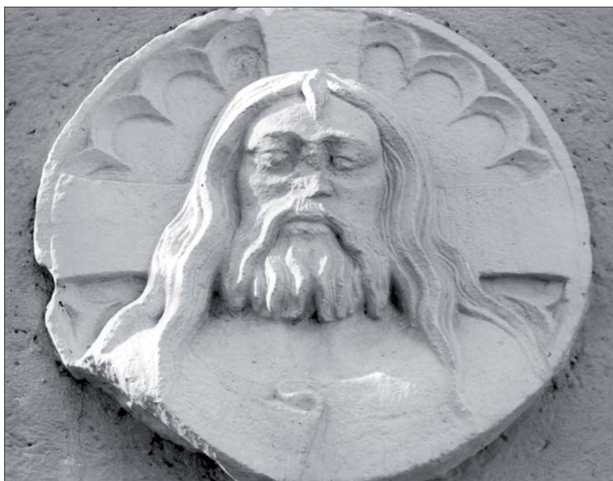
▲ Svorník uzatvárajúci klenbu v podobe hlavy Krista. Starý kláštor. An apex stone in the shape of Christ's head completing an arch. The old monastery. Einen Abschluss des Gewölbes bildende Bolzen in Form des Kopfes Christi; Altes Kloster